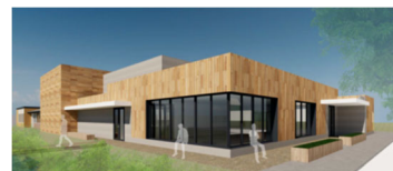
Impressie van het nieuwe gebouw (deze is voorlopig en kan nog veranderen)

Het gebouw van basisschool De Klaroen blijft grotendeels gehandhaafd, maar zal verbonden worden met het nieuwe dorpshuis door de hoofdentree en de bibliotheek in het nieuwbouwgedeelte te realiseren. Het ontwerp kunt u in deze brief terugvinden. Ook kunt u dit ontwerp en de indeling van het gebouw (vergroet) bekijken op de website van de BTOM.