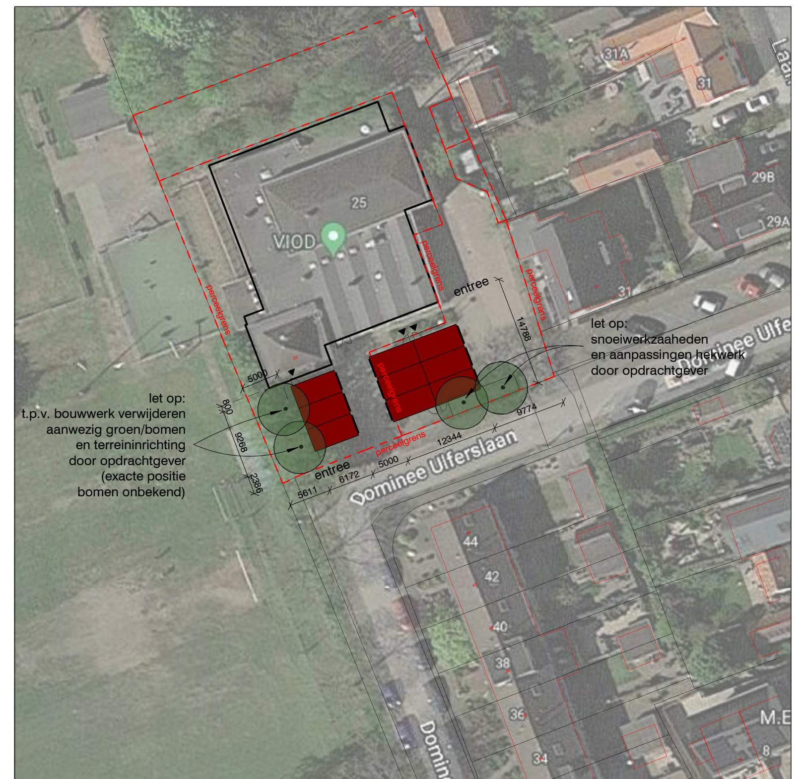
Situatie schaal 1 : 500

Kadastrale gemeente: Maarssen Sectie: I Perceelnummer: 410